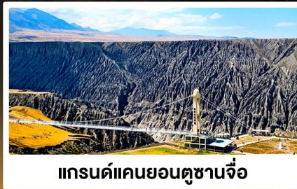
แกรนด์แคนยอนตูซานจื่อ