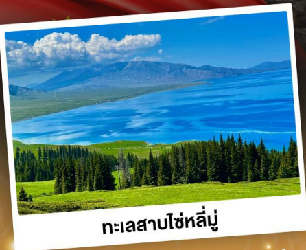
ทะเลสาบไซทหลี่มู่

ชมวิวสุดอลังการแบบยุโรปผสมเอเชีย กุ้งหลุ่ยานีเยวฉ่า ทะเลสาบสีเทอร์ควอยซ์