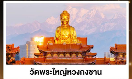
วัดพระใหญ่หวงกงซาน