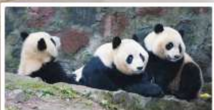
หุบเขาแพนด้า