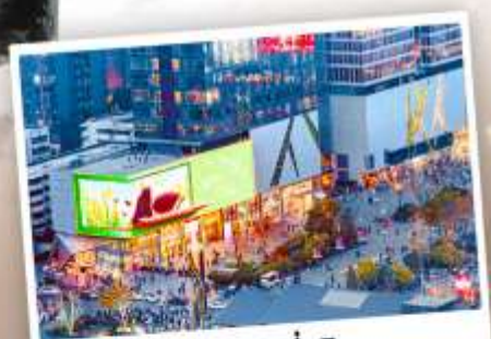
ถนนไท่กู๋หลี่หลิน