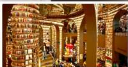
ร้านหนังสือจงซูเก๋อ