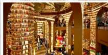
ร้านหนังสือจงซูเก๋อ

เดินทางโดย: สายการบินเฉิงตูแอร์ไลน์ (EU)