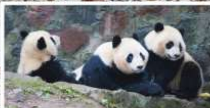
หุบเขาแพนด้า